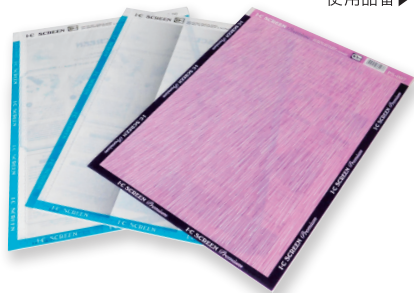
▼使用アイシースクリーン 使用品番▶

マンガ家たちが「アイシースクリーン」を使って表現した洋服の模様や影、背景描写や画面全体のムードに注目すると、この画材がマンガ表現に果たしてきた大切な役割が見てとれます。