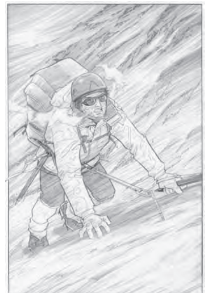
「神々の山嶺」原画 ©夢枕獯/谷口ジロー